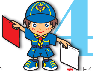
第4原画 赤・上45度 白・下45度