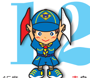
第12原画 赤白・垂直