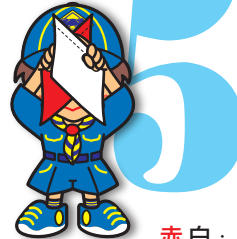
第5原画 赤白・上で交差