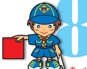
第8原画 赤・水平に