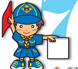
第7原画 赤・垂直 白・水平