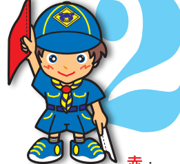
第2原画 赤・垂直に