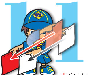
第11原画 赤白・左上45度から右下45度に