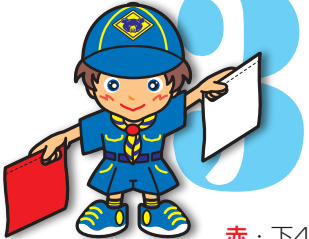
第3原画 赤・下45度 白・上45度