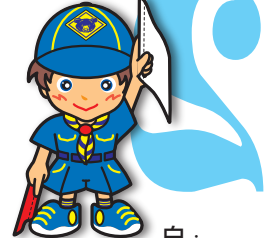
逆2原画 白・垂直に