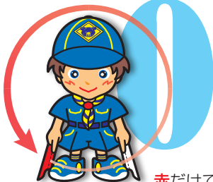
第0原画 赤だけで円を描く

手旗信号の字はカタカナを基にしてあり、第0原画を除く、14+1種類の原画の組み合わせで表現されます。まずは、この形を覚えましょう。