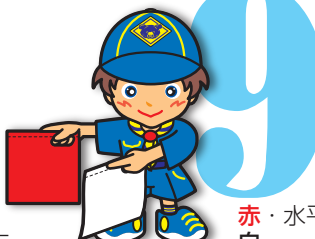
第9原画 赤・水平に 白・右下45度