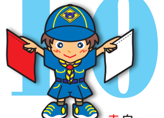
第10原画 赤白・上45度