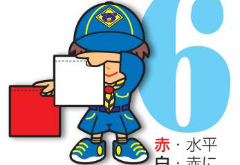
第6原画 赤・水平 白・赤に平行