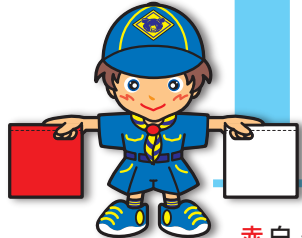
第1原画 赤・白・水平に