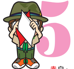
第5原画 赤白・ 上で交差