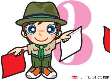
第3原画 赤・下45度 白・上45度