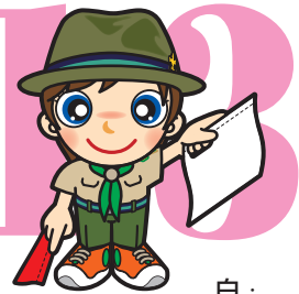
第13原画 白・ 上45度