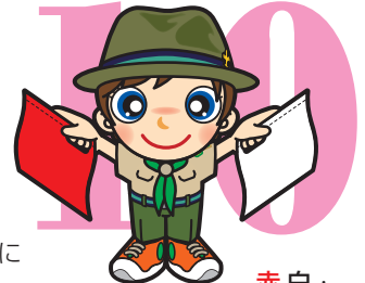
第10原画 赤白・ 上45度