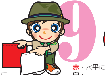
第9原画 赤・水平に 白・ 右下45度