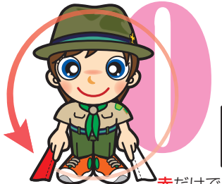
第0原画 赤だけで円を描く

手旗信号の字はカタカナを基にしてあり、第0原画を除く、14+1種類の原画の組み合わせで表現されます。まずは、この形を覚えましょう。