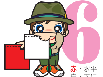
第6原画 赤・水平 白・赤に 平行