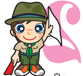
逆2原画 白・垂直に