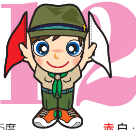
第12原画 赤白・ 垂直