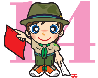
第14原画 赤・ 上45度