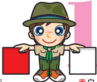
第1原画 赤白・水平に