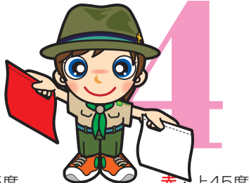
第4原画 赤・上45度 白・下45度