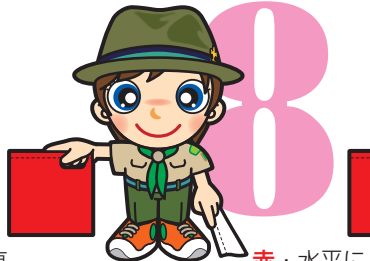
第8原画 赤・水平に