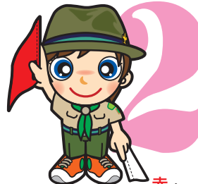
第2原画 赤・垂直に