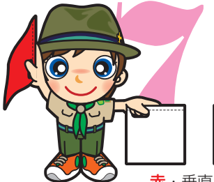
第7原画 赤・垂直 白・水平