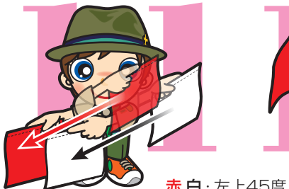
第11原画 赤白・左上45度 から右下45度に